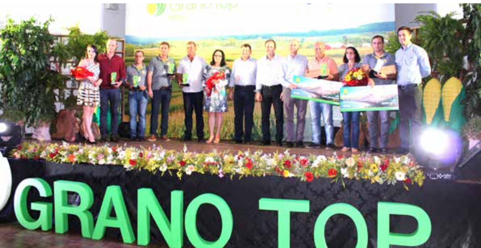
Associados da Copagril no Mato Grosso do Sul também foram agraciados durante o evento