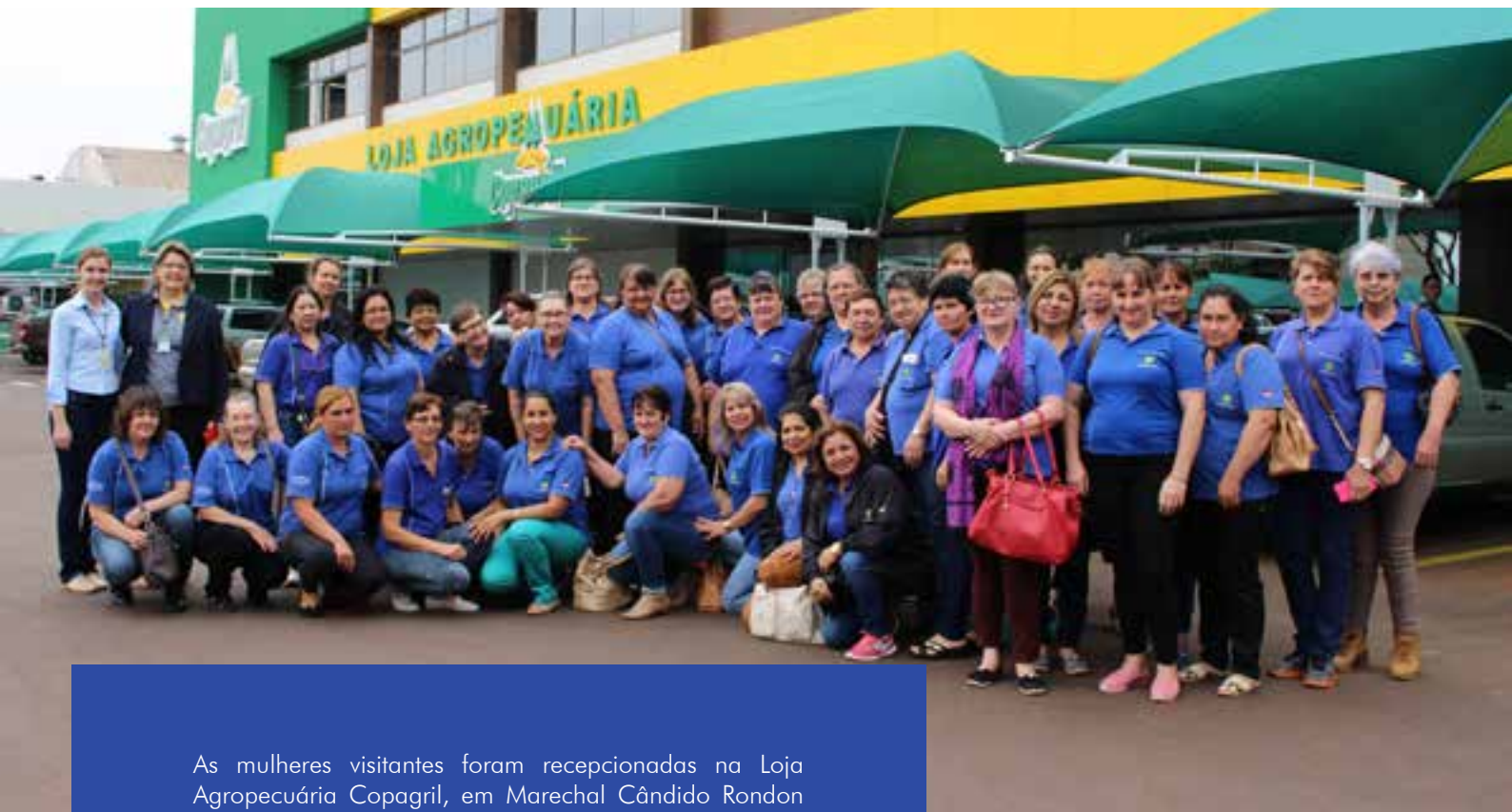
As mulheres visitantes foram recepcionadas na Loja Agropecuária Copagril, em Marechal Cândido Rondon

A visita proporcionou às mulheres paraguaias conhecer mais sobre o país vizinho, sobre o município de Marechal Cândido Rondon e a forma de organização cooperativista local, além de oportunizar a troca de experiências. 🇺🇵