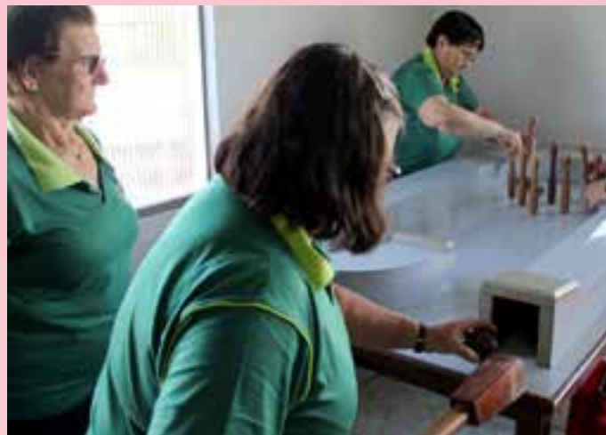
O bolãozinho de mesa é o mais disputado durante o encontro