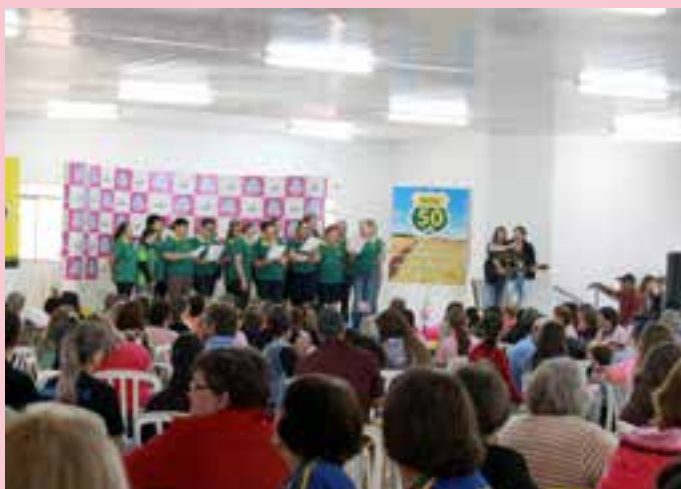
Apresentação do Comitê As Palmeirinhas

Campo de São Cristóvão; no ano de 2020 serão os comitês Raio de Luz, de Marechal Cândido Rondon e 28 de Março, de Quatro Pontes; enquanto em 2021 a organização do evento estará a cargo dos comitês As Palmeirinhas, de São José das Palmeiras e Amigas do Campo, de Entre Rios do Oeste. 🏡