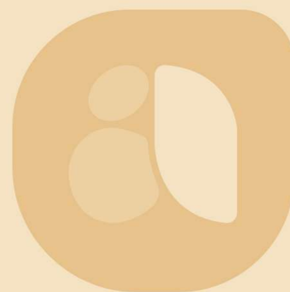
Grão/folha de trigo