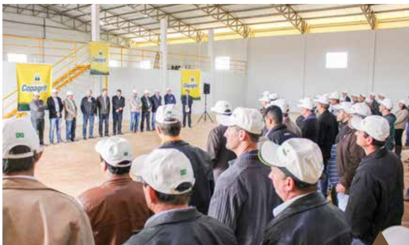
Solenidade foi prestigiada por associados do Paraná e do Mato Grosso do Sul

Outro ponto favorável para os produtores e operadores da unidade é o fato de haver duas balanças, sendo o diferencial a balança de expedição. Assim, quem embarca grãos não precisa fazer uso da balança de entrada, agilizando os processos de entrada e saída de produtos. 🌱