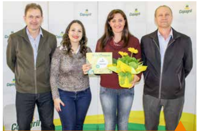
1º lugar prato massas caseiras: Rondele ao molho favorito Comitê Alegres e Unidas