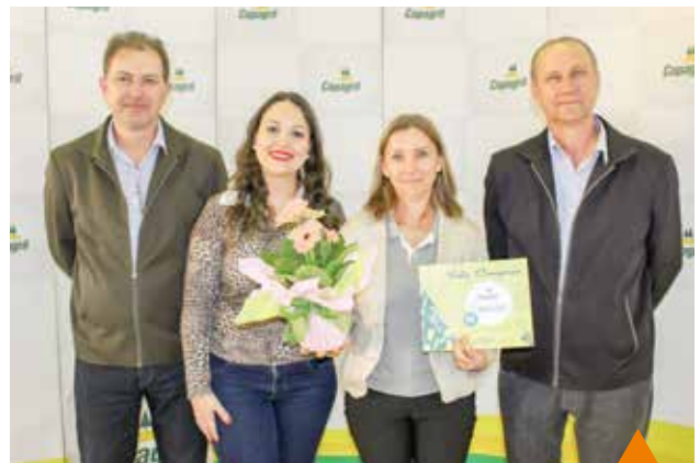
1º lugar sobremesa de leite: Sobremesa de coco queimado Comitê Amigas do Campo