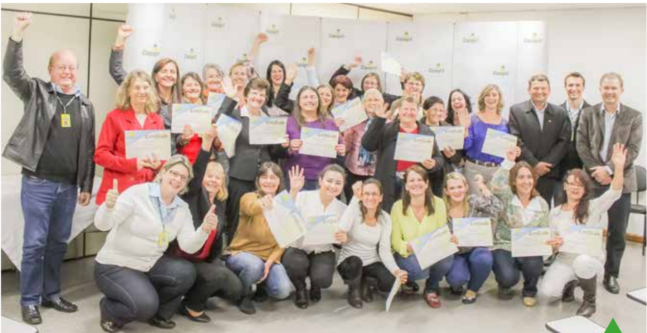
No último módulo, todos receberam certificados de participação