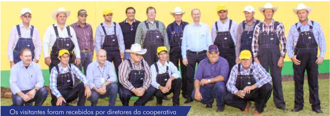
Os visitantes foram recebidos por diretores da cooperativa

O encontro de interação entre os mexicanos e a cooperativa foi intermediado pela Câmara de Comércio México-Brasil, conjuntamente com o Conselho México Brasil América Latina e o Governo do Estado de Campeche. 🌱