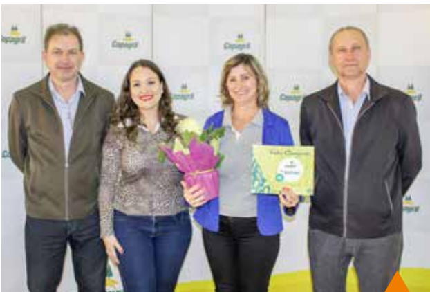
1º lugar prato à base de carne suína: Costelinha de porco assada em mostarda, shoyo, mel e gengibre - Comitê Amigas do Campo