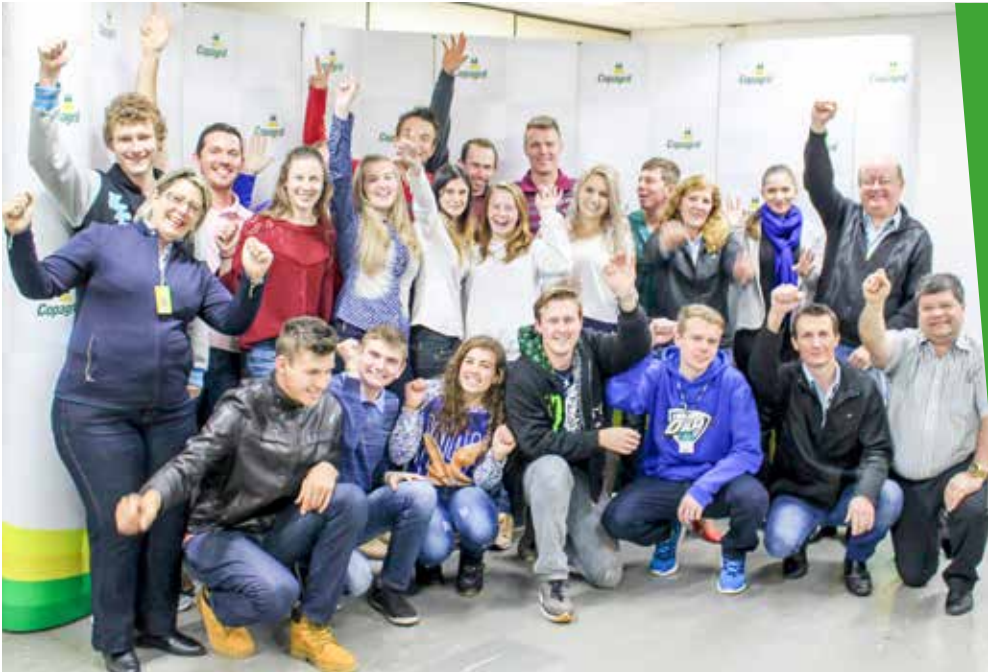
Os concluintes do curso comemoraram a conquista

A Cooperativa Agroindustrial Copagrill, por meio da Assessoria de Cooperativismo, agradece a todos pela participação e os parabeniza pela conclusão do curso. 🌱