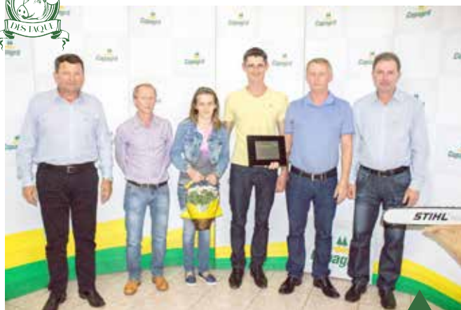
UPL com maior produtividade: Granja Deves - Linha Itá, Quatro Pontes, com 30,73 Leitões/Porca/Ano