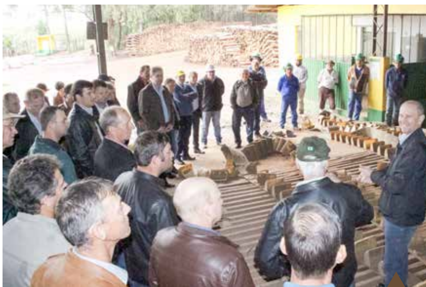
As lideranças conheceram as instalações e obtiveram informações sobre os investimentos realizados nas diferentes unidades