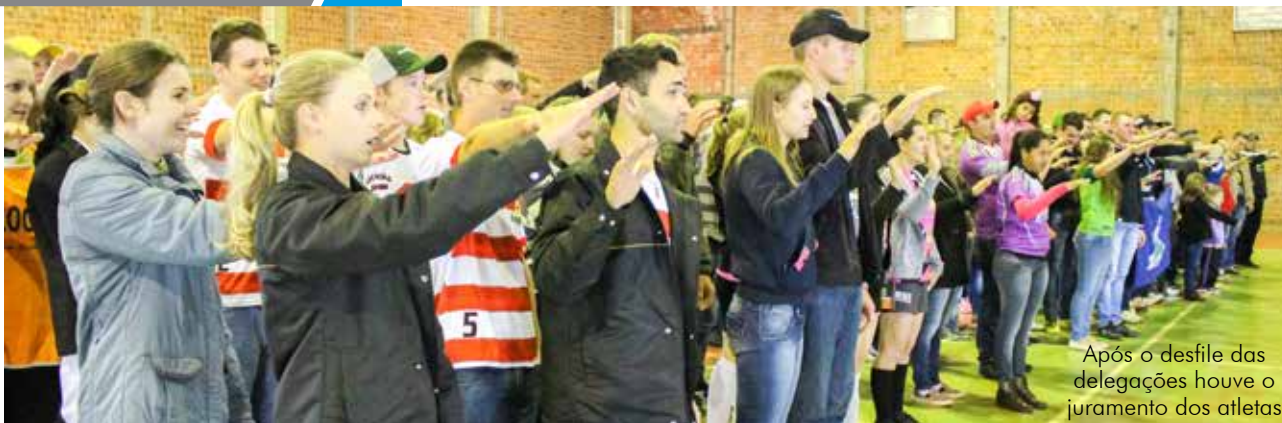
Após o desfile das delegações houve o juramento dos atletas