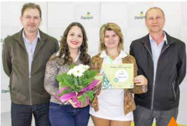
1º lugar prato cuca caseira: Cuca de requeijão com uva Comitê Raio de Luz