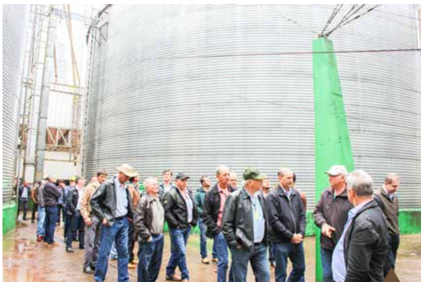
A Copagril tem unidades de recebimento de grãos e lojas agropecuárias nos três municípios visitados

Os cooperados conheceram as instalações e obtiveram informações sobre os investimentos recentemente realizados nas diferentes unidades da Copagril do Mato Grosso do Sul, bem como sobre demandas futuras de investimento nas estruturas para melhoria contínua nos procedimentos operacionais e, conseqüentemente, na prestação de serviços aos associados e clientes. 🌱