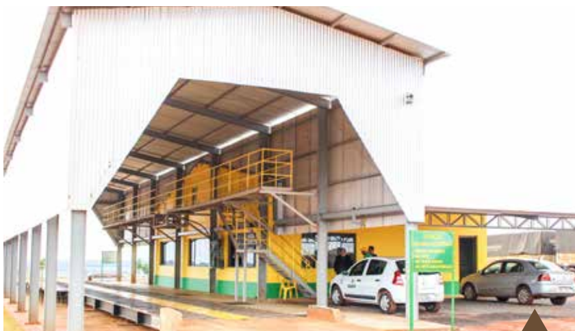
Recepção, balança e setor administrativo da unidade