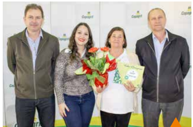
1º lugar prato geleia caseira: Geleia de Abacaxi Comitê Raio de Luz