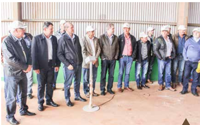
O dispositivo de descarga do tombador foi acionado para marcar a inauguração