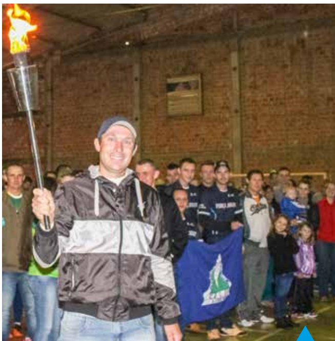
A chama olímpica foi acesa na cerimônia de abertura do evento, realizada no dia 21 de agosto, em Novo Três Passos

Em outubro acontecem as partidas de vôlei e em novembro os jogos de mesa e atletismo