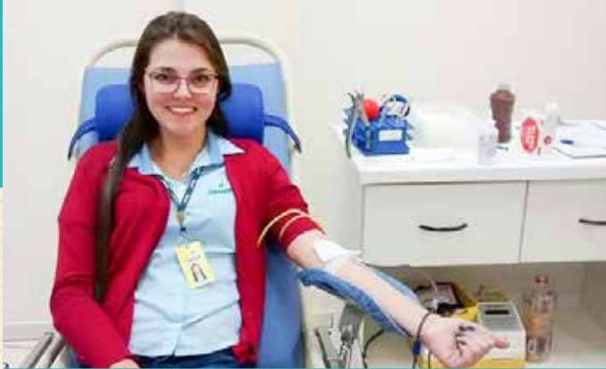
FUNÇÃOÁRIOS DA TRANSPORTADORA COPAGRIL REALIZARAM DOAÇÃO DE SANGUE