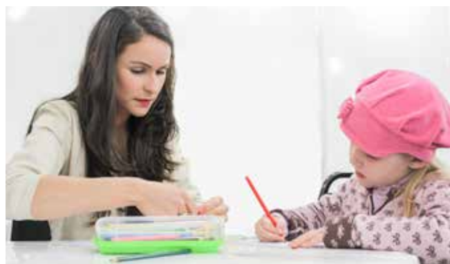
OS JOVENS ENSINARAM AS CRIANÇAS SOBRE COOPERAÇÃO

co da feira com atividades lúdicas. Lá, os jovens receberam as crianças para que elas pudessem se divertir com jogos de mesa e desenhos para colorir. 🎨