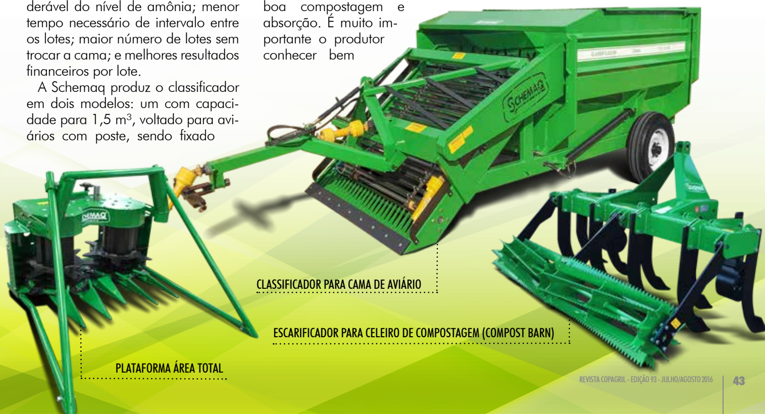
PLATAFORMA ÁREA TOTAL

Outra inovação é a plataforma área total da Schemaq, que veio para otimizar o processo de produção de forragem de milho, pois permite colher até duas linhas de milho com espaçamento de até 65 cm de largura. A plataforma já vem preparada para acoplar o kit caracol, que serve para auxiliar na recolha de milho deitado pelo vento. Além disso, também pode ser acoplada em diversas marcas e modelos de ensiladeiras. 🌱