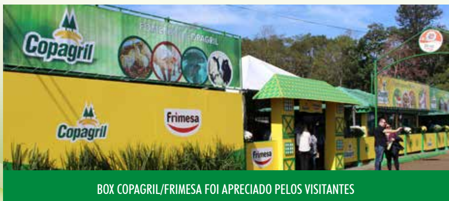
BOX COPAGRIL/FRIMESA FOI APRECIADO PELOS VISITANTES

Mais uma vez, a Copagril participou intensamente da Expo Rondon, ocupando cinco espaços diferentes dentro da festa. 🌱