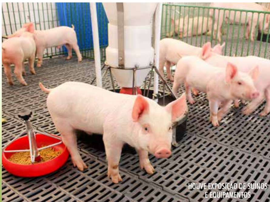
HOUE EXPOSIÇÃO DE SUÍNOS E EQUIPAMENTOS

Durante a exposição, o Fomento Suínos Copagril apresentou uma amostra de suínos com leitões em creche, suínos em crescimento/terminação e leitões em gestação. No Pavilhão Pecuário houve exposição de empresas ligadas à suinocultura, com tecnologias em nu-