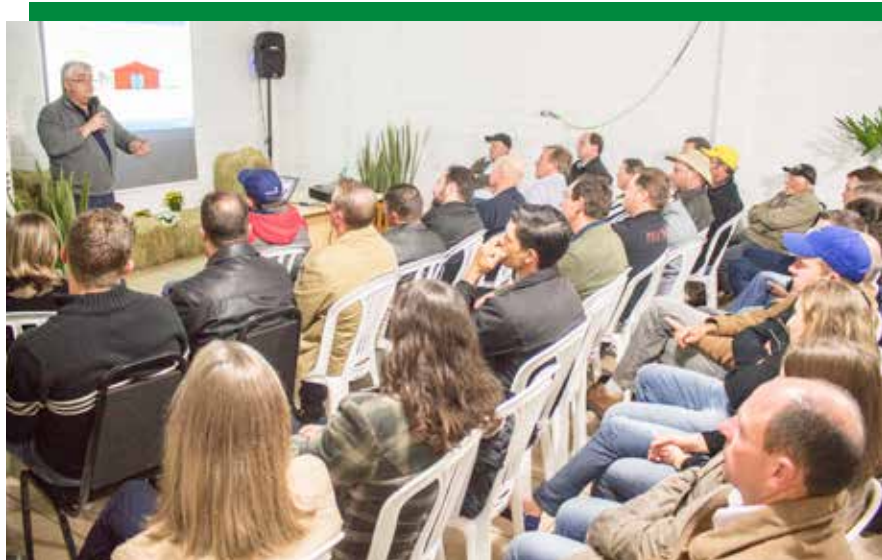
A FEIRA TAMBÉM FOI UM ESPAÇO PARA DIFUNDIR CONHECIMENTOS, A PARTIR DE PALESTRAS TÉCNICAS PROMOVIDAS PELA COPAGRIL