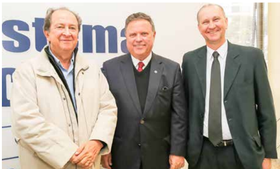
DIRETOR-PRESIDENTE DA COPAGRIL E MEMBRO DA DIRETORIA DA OCEPAR, RICARDO SÍLVIO CHAPLA, COM RICARDO CALDERARI E O MINISTRO BLAIRO MAGGI (CENTRO)

Na oportunidade, Blairo Maggi recebeu um documento com 10 propostas elaboradas em conjunto pelo Sistema Ocepar, Faep, Secretaria de Estado da Agricultura e Instituto Emater. A adoção de medidas por parte do governo federal para fortalecer o comércio internacional é uma das sugestões que foram apresentadas ao ministro. Foram encaminhadas sugestões em outras nove áreas: Política Agrícola Plurianual; planejamento estratégico para o cooperativismo paranaense; gestão de risco (seguro rural, Proagro e zoneamento agrícola); infraestrutura e logística; Programa Nacional de Conservação de Solos; venda de terras para estrangeiros; crédito rural; apoio à comercialização e defesa e sanidade no agronegócio. 🌱