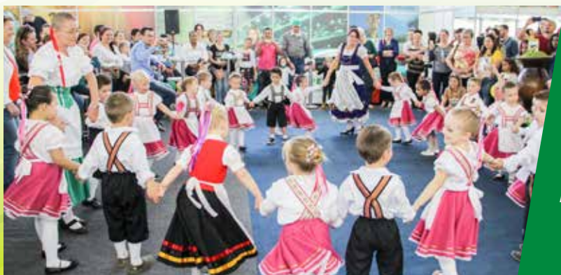
O GRUPO LOTA KARLOTA, DO CENTRO DE EDUCAÇÃO INFANTIL DA VILA GAÚCHA, REALIZOU APRESENTAÇÃO DE DANÇA GERMÂNICA