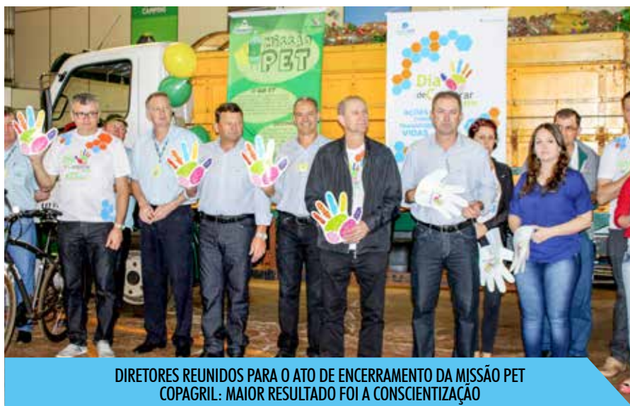
DIRETORES REUNIDOS PARA O ATO DE ENCERRAMENTO DA MISSÃO PET COPAGRIL: MAIOR RESULTADO FOI A CONSCIENTIZAÇÃO