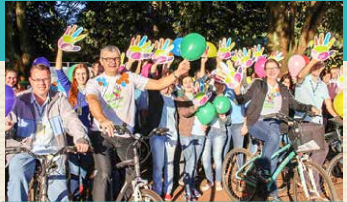
O SETOR ADMINISTRATIVO DA COPAGRIL PROMOVEU O DIA DE PEDALAR VISANDO CONSCIENTIZAR SOBRE A IMPORTÂNCIA DE USAR VEÍCULOS NÃO POLUENTES E LEVAR UMA VIDA SAUDÁVEL