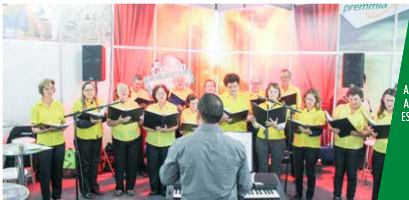
O CORAL DA AACC TAMBÉM SE APRESENTOU NO ESPAÇO COPAGRILL