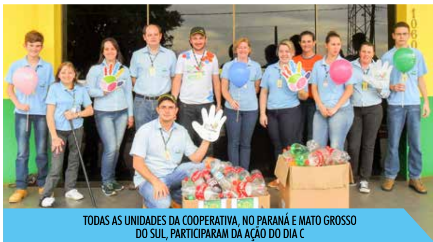
TODAS AS UNIDADES DA COOPERATIVA, NO PARANÁ E MATO GROSSO DO SUL, PARTICIPARAM DA AÇÃO DO DIA C

AS EMBALAGENS ARRECADADAS TOTALIZARAM DUAS CARGAS DE CAMINHÃO