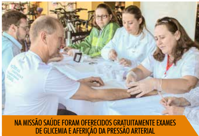
NA MISSÃO SAÚDE FORAM OFERECIDOS GRATUITAMENTE EXAMES DE GLICEMIA E AFERIÇÃO DA PRESSÃO ARTERIAL

A campanha Missão Saúde realizou atendimento a cerca de 1.000 pessoas durante a programação. 🌱