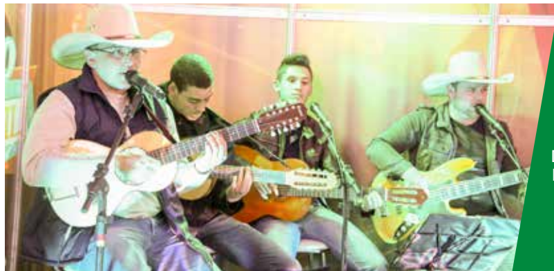
GRUPO RONDONENSE “OS MATUTOS DA VIOLA” TEVE DIVERSIFICADO REPERTÓRIO

Ao final da programação, a Copagrill avaliou que o objetivo do novo espaço foi alcançado: evidenciar a cultura, abrir oportunidade para os valores locais e tornar o ambiente da cafeteria ainda mais acolhedor para receber o público. 🌱