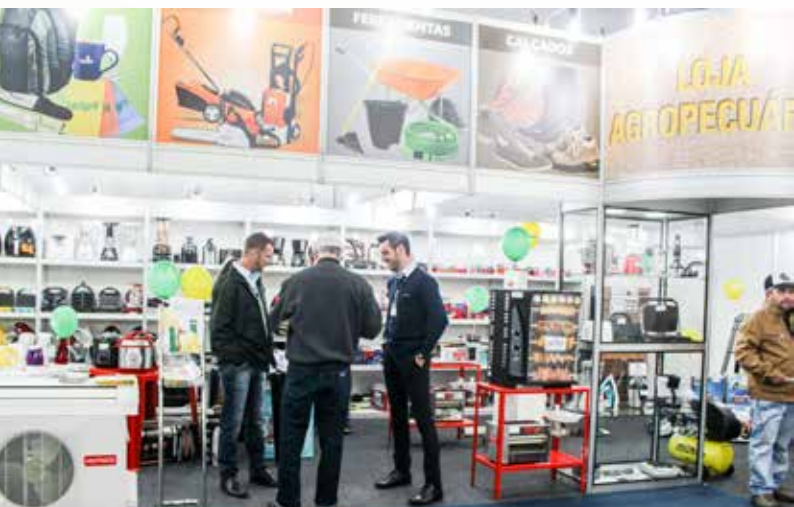
LOJAS AGROPECUÁRIAS COPAGRIL LEVARAM GRANDE VARIEDADE DE PRODUTOS PARA A FEIRA