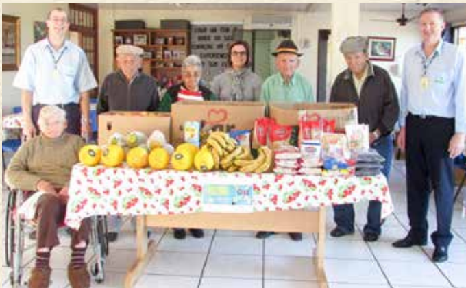
DOAÇÃO DE ALIMENTOS AO ASILO FOI O PROJETO DO SUPERMERCADO COPAGRIL I, DE MARECHAL CÂNDIDO RONDON