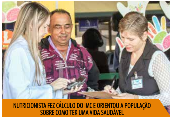
NUTRICIONISTA FEZ CÁLCULO DO IMC E ORIENTOU A POPULAÇÃO SOBRE COMO TER UMA VIDA SAUDÁVEL