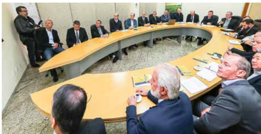
O MINISTRO PARTICIPOU DE REUNIÃO COM OS DIRETORES DA OCEPAR, NO DIA 08 DE JULHO, EM CURITIBA

O evento foi realizado por meio de parceria entre o Sistema Ocepar, Federação da Agricultura do Estado do Paraná (Faep), Instituto Emater e Universidade Federal do Paraná (UFPR).