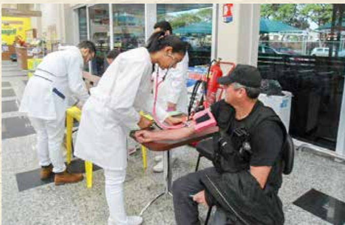
O ESTÍMULO AOS CUIDADOS COM A SAÚDE É UMA CONSTANTE NA COPAGRIL, COMO DEMONSTROU A EQUIPE DO SUPERMERCADO COPAGRIL DE GUAIÁRA