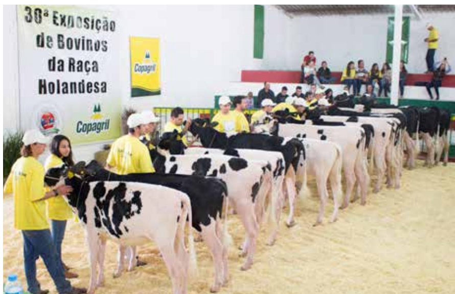
DURANTE O EVENTO, ACONTECEU O JULGAMENTO DE BOVINOS DA RAÇA HOLANDESA

As Unidades Industriais de Rações tiveram estande na Expopecuária, onde foram apresentadas as rações Copagril, com ênfase nas rações bovinas e seu diferencial para maior produtividade. 🌱