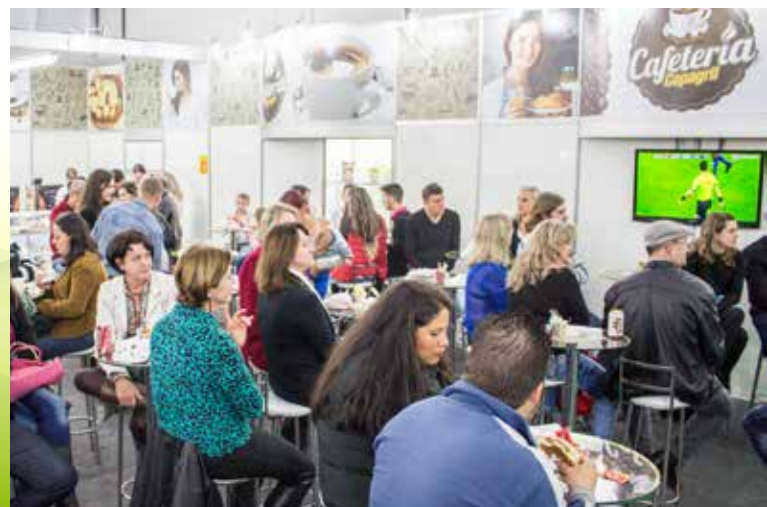
CAFETERIA COPAGRIL FOI BASTANTE FREQUENTADA PELO PÚBLICO DA EXPO RONDON 2016