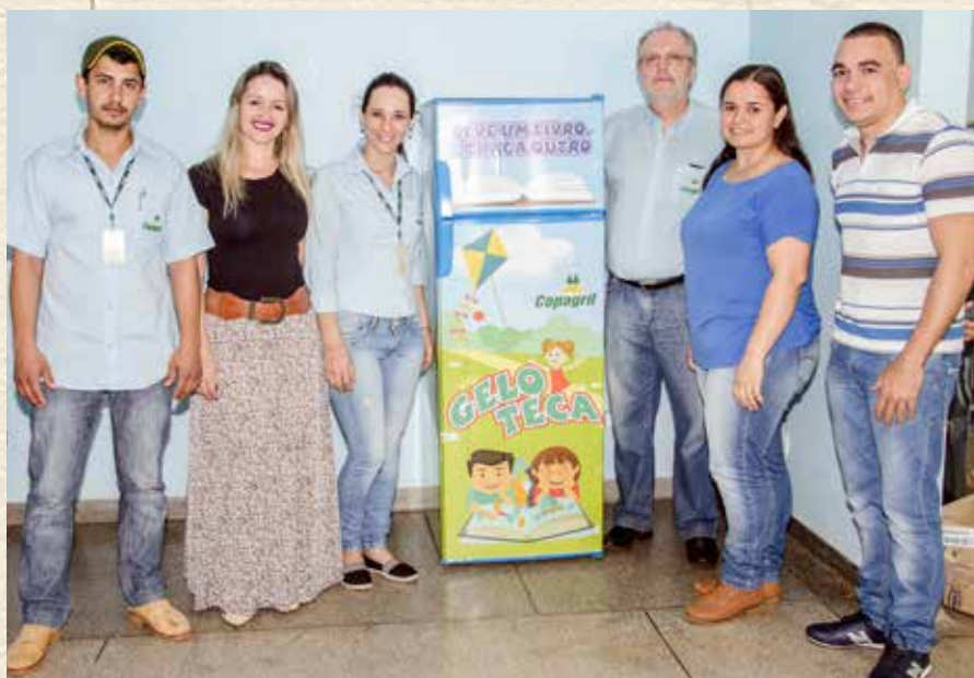
A UNIDADE COPAGRIL DE MUNDO NOVO (MS) FEZ UMA GELADEIRA BIBLIOTECA, CHAMADA GELOTECA, QUE FOI COLOCADA NO POSTO DE SAÚDE CENTRAL DO MUNICÍPIO COM O OBJETIVO DE INCENTIVAR A LEITURA E A TROCA DE LIVROS

mente definidas as suas diretrizes, missão, visão e valores, age no presente com os olhos nessas diretrizes estratégicas. Promove o desenvolvimento do agronegócio regional, enquanto pratica ações da filosofia cooperativista. As ações desenvolvidas sob o tema de cooperação, durante a 5ª Semana da Cultura Organizacional, expressam o entendimento do quadro funcional, apoiada pela empresa, daquilo que é ser Copagril. 🌱