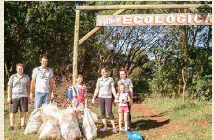
ALGUMAS UNIDADES, COMO AS DE IGUIPORÁ E PORTO MENDES, REALIZARAM RECOLHA DE LIXO EM AMBIENTES PÚBLICOS: PRESERVAÇÃO DO MEIO AMBIENTE